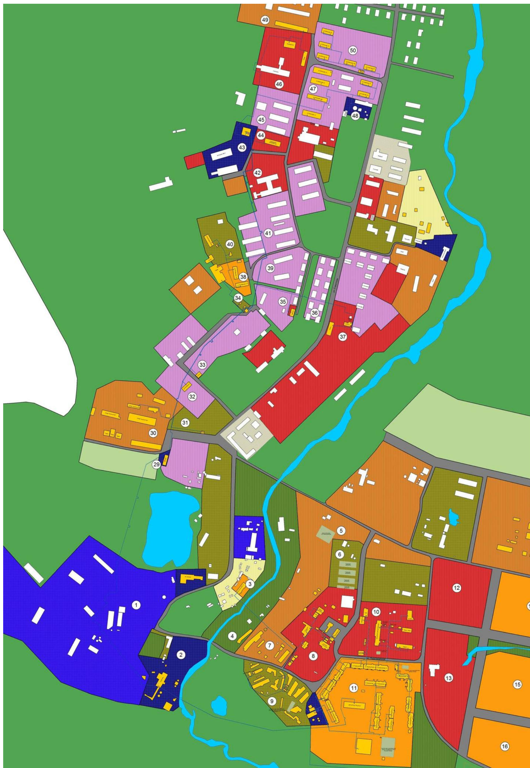
Рисунок 2. Существующая схема теплоснабжения от котельной №1 муниципального образования городское поселение Угольные Копи