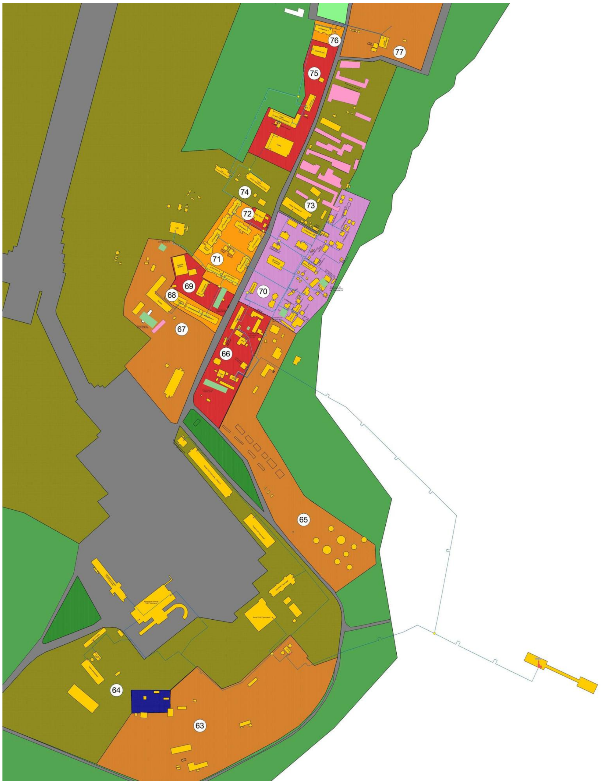
Рисунок 3. Существующая схема теплоснабжения от котельной №2 муниципального образования городское поселение Угольные Копи